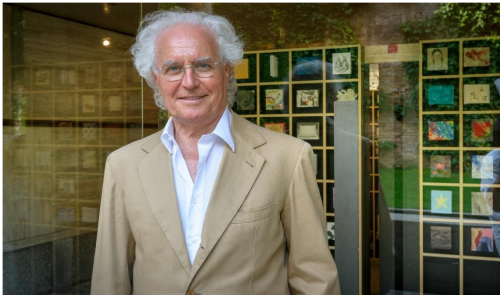
Ο Luciano Benetton.

Μάλιστα στην έκθεση θα παρουσιαστή και το ντοκιμαντέρ Shame and Souil του Βρετανού φωτογράφου Giles Duley και του εικαστικού από τη Συρία Semaan Khawam. Ένα ντοκιμαντέρ που ξεκινάει με τη συνάντησή τους στη Βηρυτό και θέλει να αποδείξει ότι δεν πρέπει να υπάρχουν εμπόδια ανάμεσα στους ανθρώπους, όταν η καρδιά έχει αποφασίσει το τι θέλει.