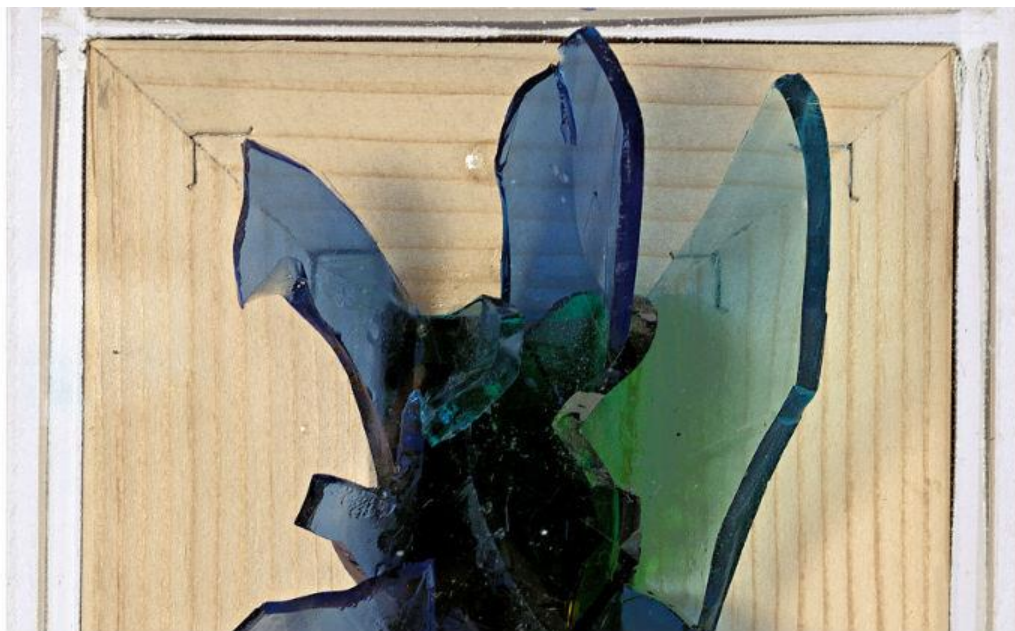
Έργο του Μιχάλη Κατζουράκη

στη Βηρυτό και η ιστορία τους συμβολίζει ότι δεν υπάρχουν εμπόδια μεταξύ των ανθρώπων.